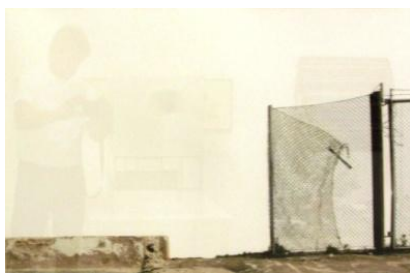
Andreas Johansson. Utan titel. Collage.