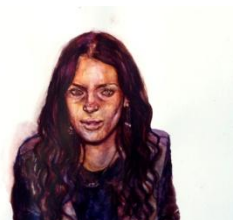
Elin Elfström Car keys. Akvarell.