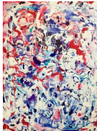
Jim Thorell. Bloody christsals. Akryl på duk.