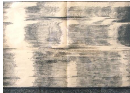
Sara Wallgren. The Ghost in the Machine.