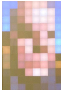
Niels Bonde. Selfie stick.